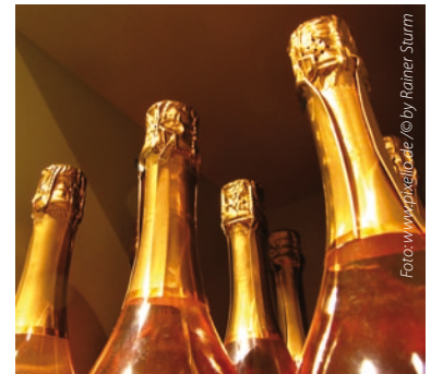
Die Kennzeichnung „Regional“ wird ab Seite 154 dargestellt.

Mit einer Regionalkennzeichnung einher geht gleichsam auch eine bestimmte Verbrauchererwartung an ein so gekennzeichnetes Produkt. Mit dem Hinweis auf die spezifische Herkunft eines Lebensmittels verbindet der Verbraucher besondere Eigenschaften hinsichtlich der Güte oder des spezifischen Charakters. Regelungen zu geographischen Herkunftsangaben finden sich im nationalen Recht zum einen im Markengesetz (MarkenG), zum anderen im Gesetz gegen den unlauteren Wettbewerb (UWG). Diese Gesetze sind der nationalstaatliche Rahmen, der bei einer Zeichenvergabe zu berücksichtigen ist. Auf nationaler Ebene existieren zudem diverse Regionalkennzeichnungen (z.B. Regionalsiegel der Vermarktungsgesellschaften der Bundesländer, Regionalsiegel/-marken des Lebensmitteleinzelhandels, die Siegel regionaler Initiativen sowie Firmen- und Markennamen mit regionalem Bezug), die auf der privatrechtlichen Ebene angesiedelt sind. Neben den gemeinschaftsrechtlichen Bestimmungen zum Markenrecht regeln insbesondere die allgemeinen Verordnungen sowie die produktspezifischen Verordnungen den Schutz geographischer Angaben im Bereich Lebensmittel, Wein und Spirituosen. Das Gemeinschaftsrecht bildet ein gemeinschaftsweites Schutzsystem für einen Teilbereich der geographischen Herkunftsangaben. Autor Timo Weitzel geht in seinem Artikel ab Seite 154 auf die verschiedenen Regelungen zur Kennzeichnung „Regional“ ein.